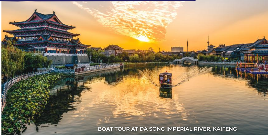
BOAT TOUR AT DA SONG IMPERIAL RIVER, KAIFENG