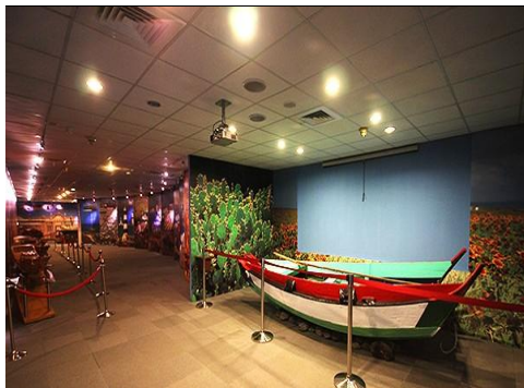
澎湖国家风景区管理处

集合于吉隆坡国际机场，办理登机手续后飞往澎湖。抵达后入境，前往澎湖国家风景区管理处参观，馆内设有丰富的展示内容与导览解说，包括柱状玄武岩及王船模型等，让游客深入了解澎湖的自然景观与历史文化。随后前往妈祖文化园区参观。园区内矗立着耗资 5.5 亿元打造的妈祖巨像，高达 66 公尺（约 22 层楼高），为全球最高的妈祖像之一。庄严宏伟的妈祖像面向大海，守护当地居民与渔民平安，极具震撼力与观赏价值。