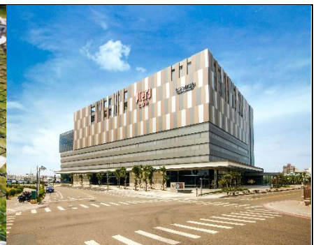
澎湖首座大型购物中心