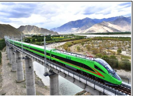
拉林铁路高原复兴号