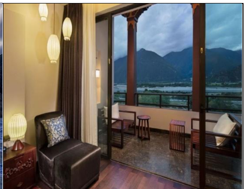
Hilton Linzhi Resort