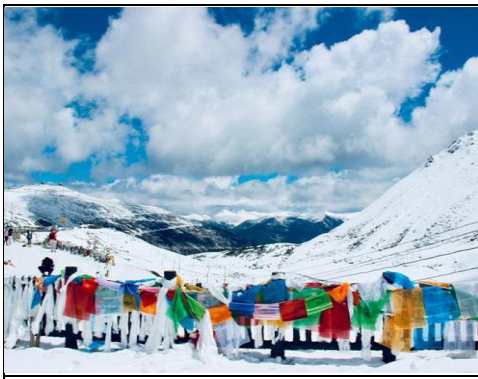
Sejila Mountain Pass