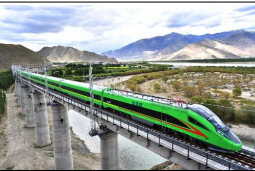
Lalin Railway Fuxing High-Speed Train