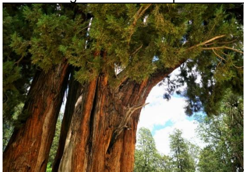
Giant Cypress Forest

After breakfast, travel to Nyingchi and visit the Giant Cypress Forest , home to the renowned "King of the World Giant Cypress." . The largest tree measures approximately 18 metres in circumference, stands 50 metres tall, and is believed to be over 2,500 years old, earning the titles "King of Cypress Trees" and the "Sacred Bon Tree." Continue to Kading Valley , a national AAAA scenic attraction, also known as Gading Valley. Its Tibetan name means "Fairylad on Earth." Highlights include the 200-metre Tianfo Waterfall, naturally formed Buddha images on the cliff face, lush gorges, and breathtaking hidden landscapes.