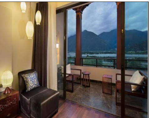
林芝工布庄园希尔顿酒店