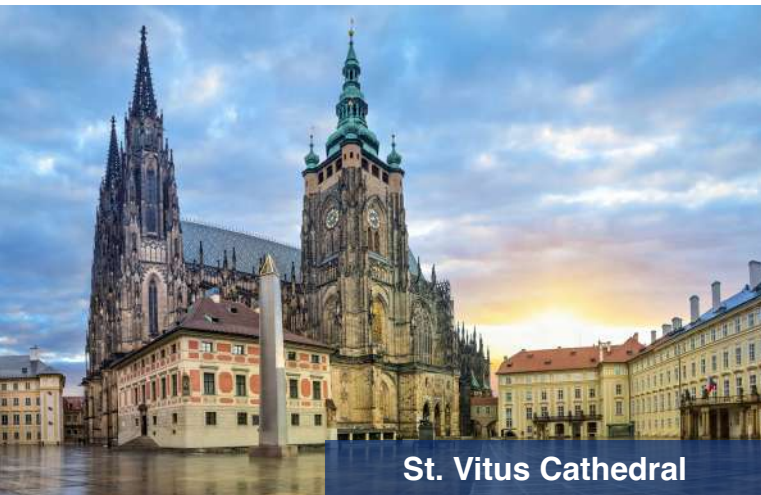
St. Vitus Cathedral